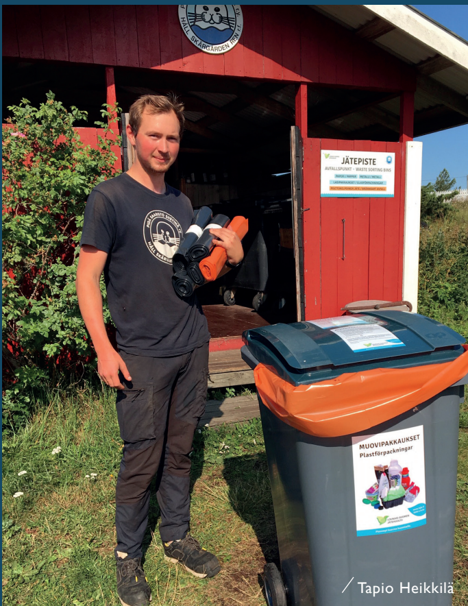
Biojätettä ja muovipakkauksia kerätään nyt Saaristomerellä ja Pohjanlahdella.