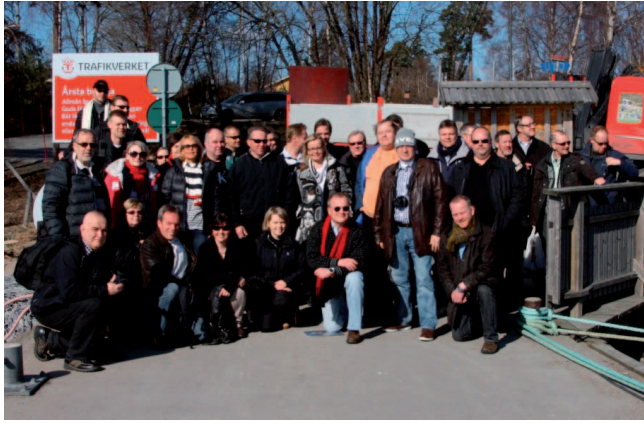
Vuotuinen Satamat ja ympäristö -seminaari järjestettiin M/S Viking Mariellalla ja Ruotsin Utössä.